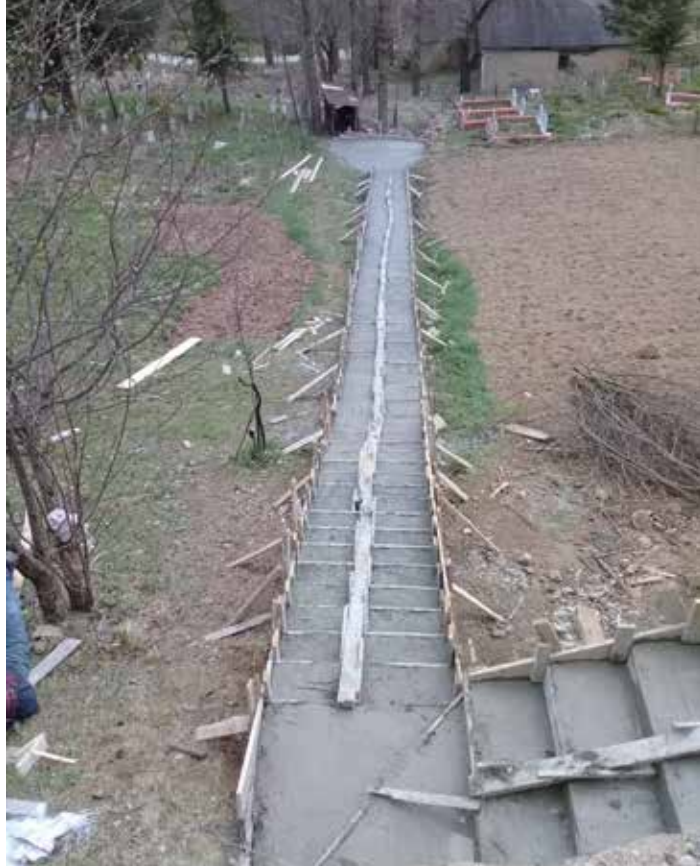
De trapconstructie op de begraafplaats van Erdem, waardoor Necla na drie jaar eindelijk een bezoek kon brengen aan het graf van haar zoon.

het noodlottige ongeval, lukt het haar weer zelf naar het toilet te gaan. Moeizaam, maar het lukt. Zichzelf wassen en aankleden lukt haar niet en dat zal ze door de gedeeltelijke verlamming ook nooit meer kunnen. Maar ze heeft weer wat meer de regie over haar eigen leven, en is weer enigszins mobiel.