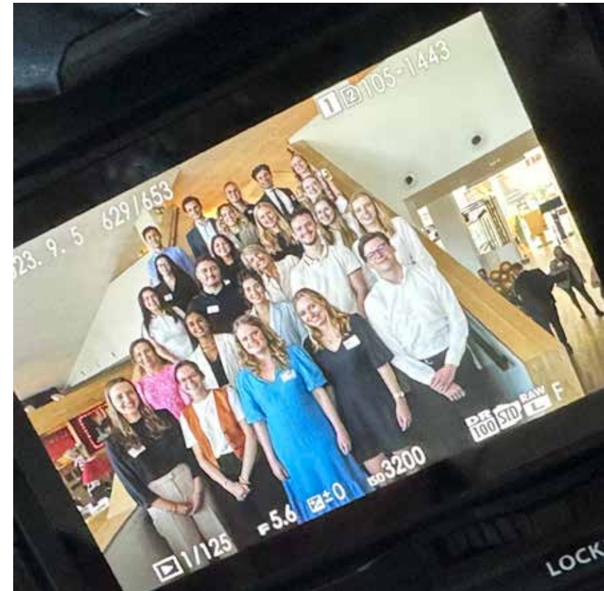
De lichten 2023-2024

De keuze om de master zo kleinschalig te maken hangt er ook mee samen dat we op deze manier voor onze partnerkantoren een behapbare groep vormen. Al vanaf het eerste jaar hebben we de samenwerking gezocht met kantoren in de praktijk. We vinden het fijn dat onze studenten de A&V-praktijk ook van binnen leren kennen, maar ook vinden we het belangrijk dat die praktijk onze A&V-studenten ontmoet. Met een groep van onze omvang kun je ook goed ontvangen worden. Die bedrijfsbezoeken betekenen veel voor de studenten en voor ons. In het tweede blok verzorgen we de twee kernvakken: Capita Aansprakelijkheidsrecht en Capita Verzekeringsrecht. Onze inzet is om in dit blok zo weinig mogelijk colleges aan de universiteit te geven. Die collegezalen, die kennen ze nu wel. In plaats daarvan geven we – bij de aan onze master geassocieerde partnerkantoren – onderwijs op locatie. We worden op zo'n dag ontvangen op een advocatenkantoor,