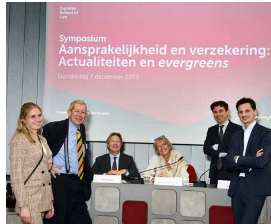
Gewaardeerde sprekers bij het symposium Aansprakelijkheid en Verzekering 2023, tezamen met het A&V-team.

Ik kijk om die reden ook erg uit naar de Mastercourse Aansprakelijkheid en Verzekering die eind februari weer van start gaat. De Master-